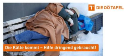
Wichtige Rucksäcke für obdachlose Menschen Gemeinsam schaffen wir das!

Gerade jetzt ist eine wärmespendernde Unterstützung für obdachlose Mitmenschen dringend notwendig. Jeder Rucksack, der ausgehändigt wird, hilft den vielen Betroffenen durch die kälteste Zeit des Jahres . Bitte helfen auch Sie mit und schenken Sie Wärme!